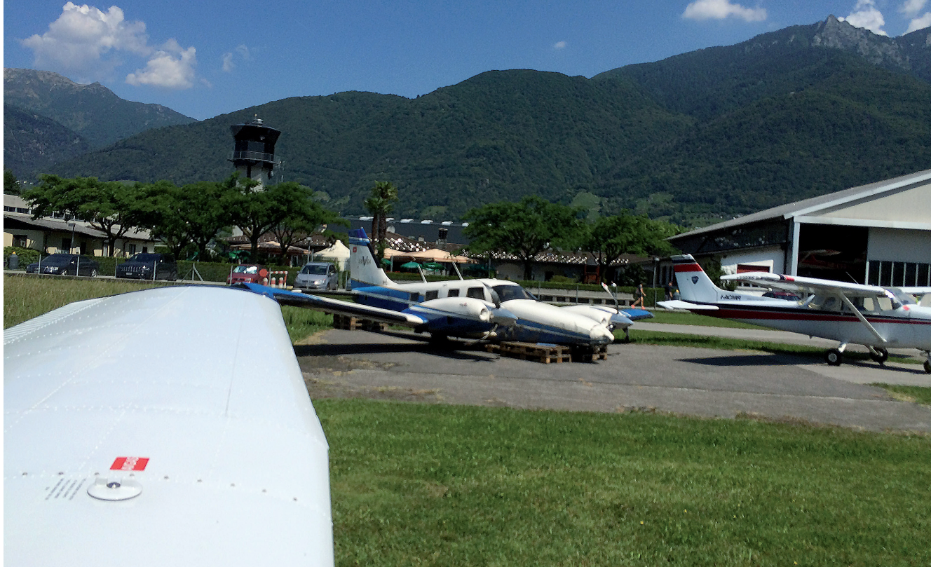
Illustration: Andreas Fischer

Lors du départ avec positionnement des volets zéro, le bimoteur n'a pas accéléré suffisamment sur la piste en herbe malgré la pleine puissance déployée. En raison d'une interruption du décollage intervenue trop tard, la machine a dépassé la fin de la piste.